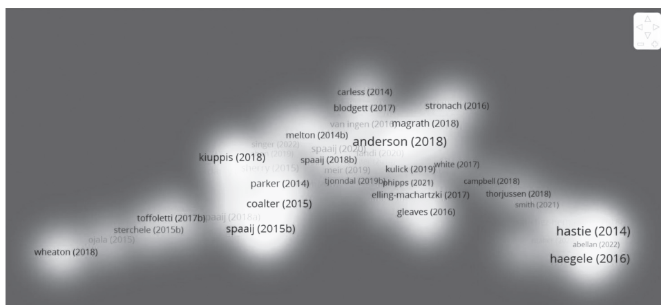
Рисунок 3 – Провідні публікації авторів, що стосуються інклюзії в спортивній неформальній освіті, мережева візуалізація.

R. Spaaij з Університету Вікторії в Австралії проводить дослідження з соціології спорту та соціології тероризму та насильницького екстремізму, міждисциплінарні розвідки, зосереджені на перетині різноманітності, справедливості та